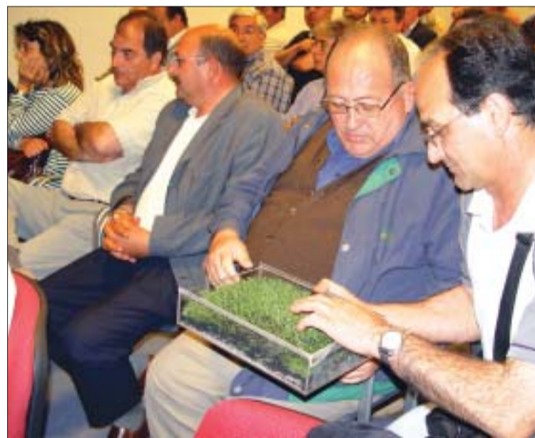
>> Els assistents van poder comprovar com serà la gespa dels camps

"Serà un equipament de qualitat pel que fa al confort i materials"