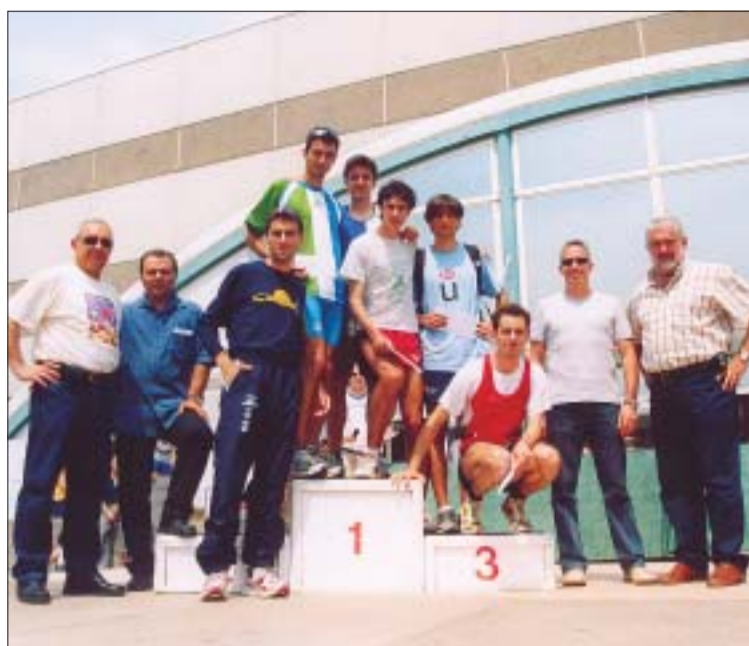
>> Els sis primers classificats de la general amb les autoritats municipals