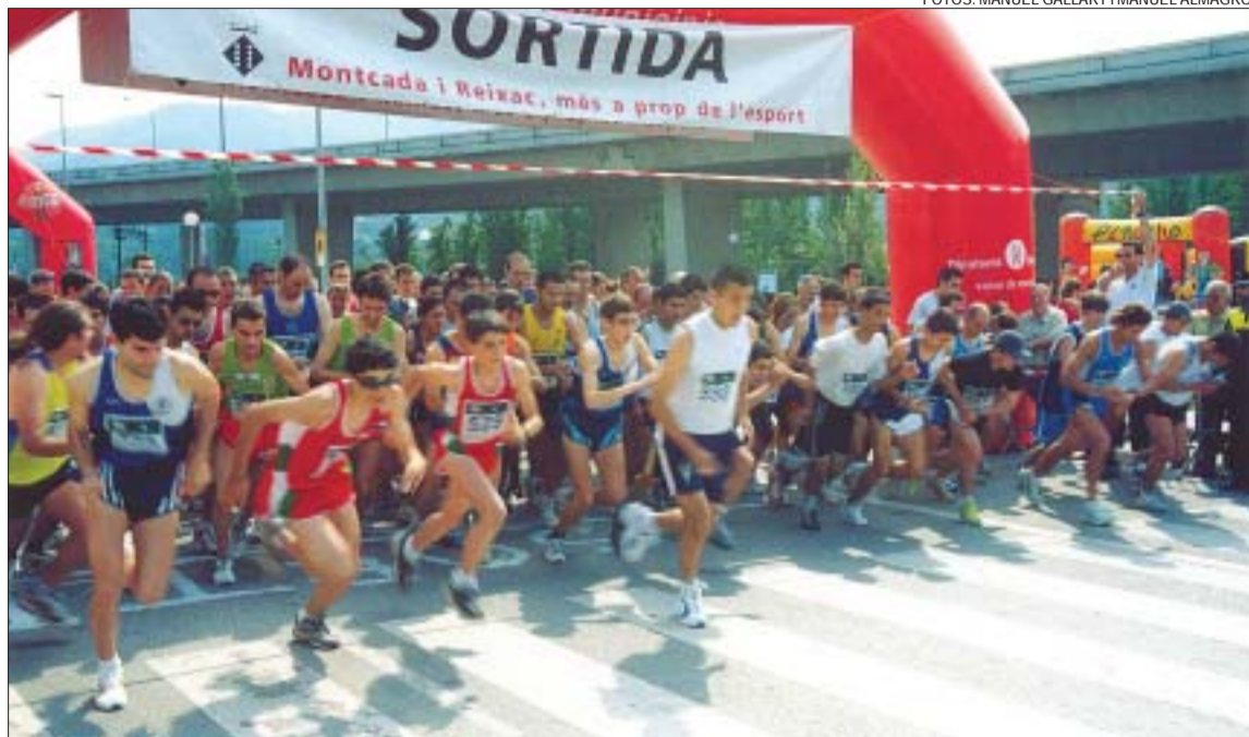
>> Moment de la sortida de la cursa de 5.500 metres, que va comptar amb un total de 123 participants