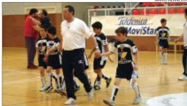
>> Els benjamins van aconseguir la segona posició