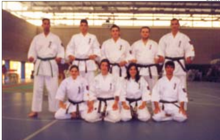
&gt;&gt; Els karateques del Shi-kan van guanyar un total de 8 medalles