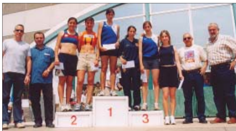
>> El podi amb les sis primeres classificades en categoria femenina

El canvi d'ubicació de la sortida i l'arribada, davant del pavelló Miquel Poblet, va agradar als corredors i als espectadors. Els