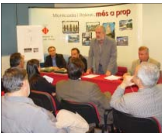
>> L'alcalde va explicar als assistents l'avantprojecte. A la foto de la dreta, l'arquitecte mostra els tipus de gespa