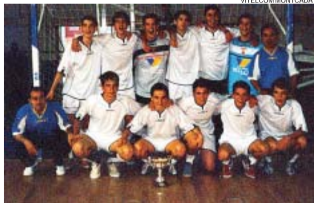
>> Equip cadet A del Vitelcom Montcada