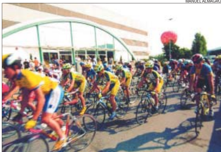
&gt;&gt; L'any passat, Montcada va ser escenari de dues sortides de la Volta